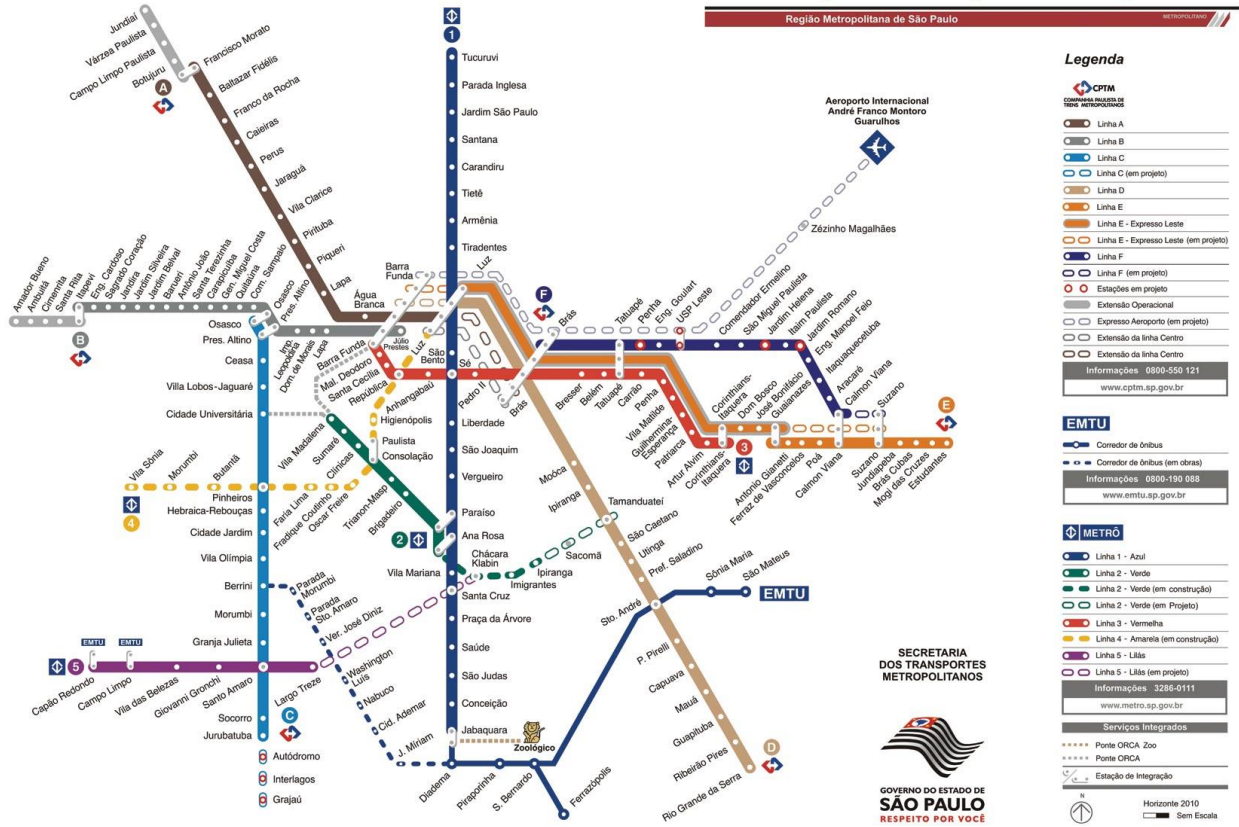
Mapa do metrô São Paulo