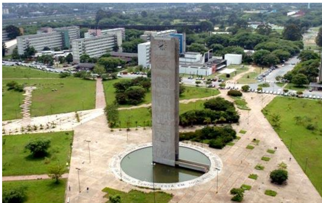
Foto: Praça do Relógio.

A Universidade de São Paulo (USP) é uma universidade pública, mantida pelo Estado de São Paulo e ligada à Secretaria de Estado de Desenvolvimento Econômico, Ciência e Tecnologia. Criada em 1934, a Universidade de São Paulo é uma das mais importantes instituições de nível superior do Brasil. No ranking Academic Ranking of World Universities (ARWU) , criado em 2003 e elaborado pelo Center for World-Class Universities da Shanghai Jiao Tong University , que classifica as 500 melhores universidades do mundo, a USP ficou na 147ª posição (para maiores informações, acesse: http://www5.usp.br/institucional/a-usp/historia/ ).